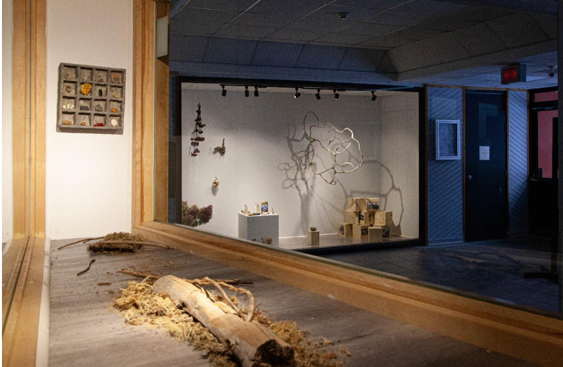
Juliette Châteauvert – Au sud du nord, 2024