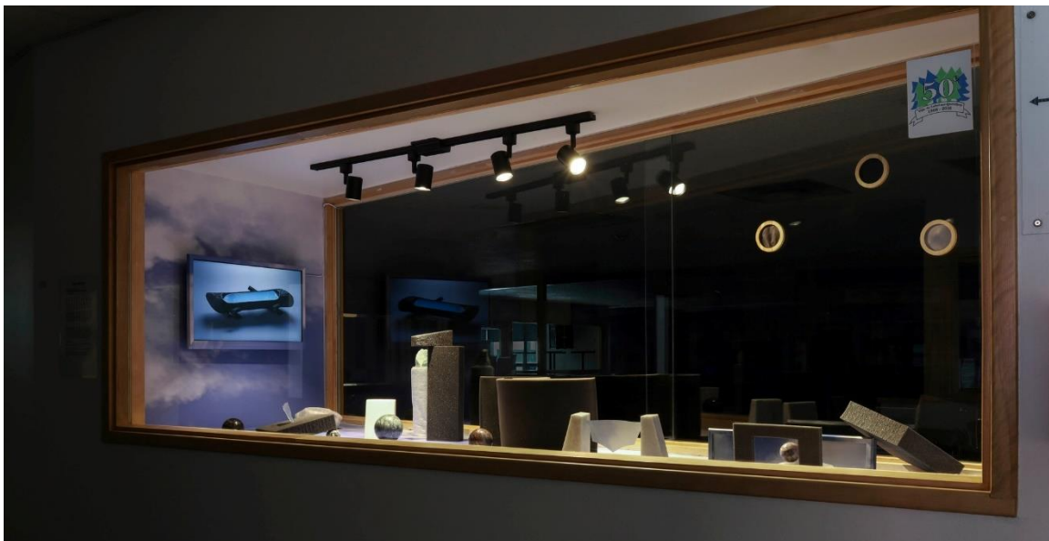
Le Club de prospection figurée – Entre Terre et Ciel, 2024

Les Vitrines, par leur format accessible et intégré à un lieu de passage, offrent un espace privilégié pour des propositions qui entrent en dialogue avec la communauté locale. Les projets peuvent inclure, sans s'y limiter, des approches participatives, des collectes de récits, des interventions in situ ou des œuvres adaptées à une proximité quotidienne avec le public.